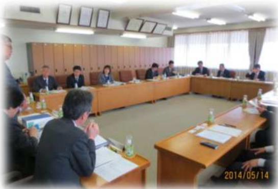
北海道栗山町議会 (平成26年5月14日(水))