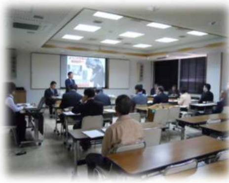
熊本県御船町議会 (平成25年4月18日(木))