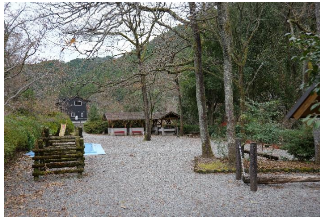
バーベキュー棟（炊事場含む）