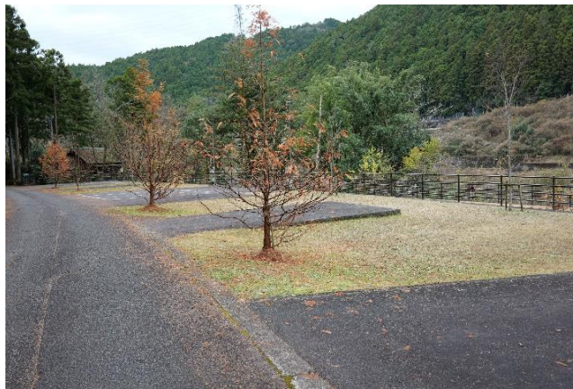
オートサイト (山側)