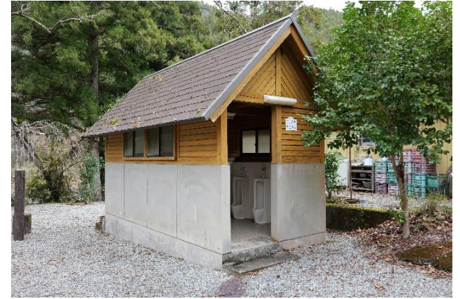
多目的広場トイレ