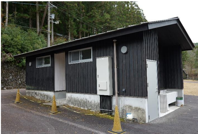
テントサイトトイレ棟（炊事場含む）