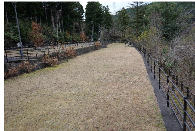
テントサイト (川側)