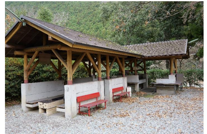
バーベキュー棟（炊事場含む）