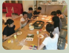
…リラックスタイム…

那賀町や徳島の銘菓・名産品の紹介、相生晩茶や徳島で焙煎した珈琲を飲みながら、ゆったりとしたティータイムを満喫。 ※食物アレルギーの方は、事前にご連絡下さい。