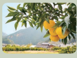
…ゆず狩り・郷土料理…

ゆず畑で自ら収穫したゆずや、地物の野菜を使った、地域の人から郷土料理を教わります。昼食会の交流も楽しみ。