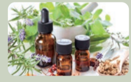
…アロマセラピー・足湯…

緑に囲まれた自然豊かなスペースで、アロマトリートメントと足湯浴でリフレッシュ。ワークショップで、木頭ゆずをブレンドした、オリジナルオイル作りも楽しめます。