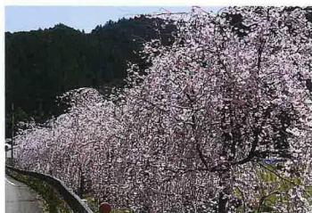
近くに「しだれ桜」の名所があります