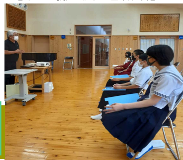
【6/16木頭小中薬物乱用防止教室】