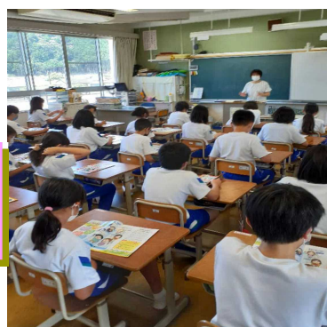
【6/28鷲敷小スマホ使用教室】