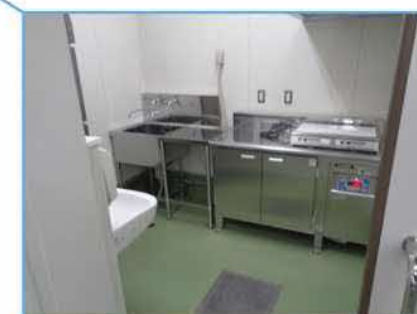
アレルギー食調理室