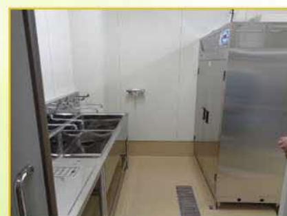
器具洗浄コーナー