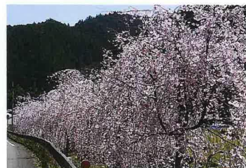
近くに「しだれ桜」の名所があります