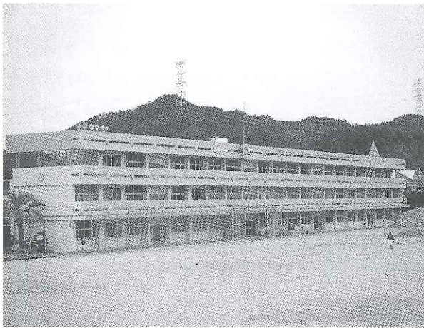
相生中学校 耐震補強と外壁改修